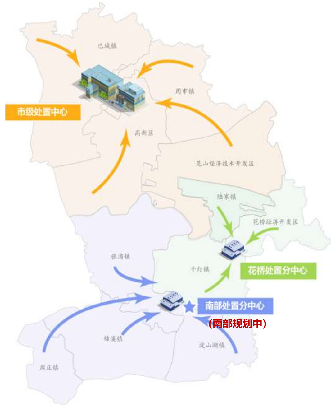
处置场一核两翼布局